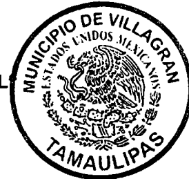
C. GUSTAVO ESTRELLA CABRERA

ATENTAMENTE "EL PRESIDENTE MUNICIPAL CONSTITUCIONAL"